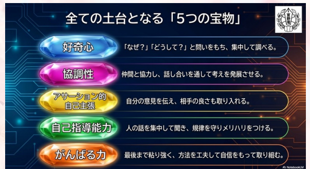
中学校で獲得する「宝」: 説明スライド

本校は「一人一人を生かす教育を充実させ、心豊かで、人を思いやり自ら学び、考え、正しく行動する、心身ともに健康な生徒を育成する」という学校教育目標のもと、教職員が一丸となって「チーム宜中」として日々の教育活動に励んでおります。